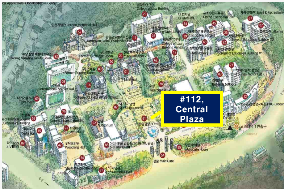
Humanities and Social Sciences Campus (#112, Central Plaza)